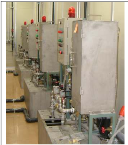
工作機 4 台への設置