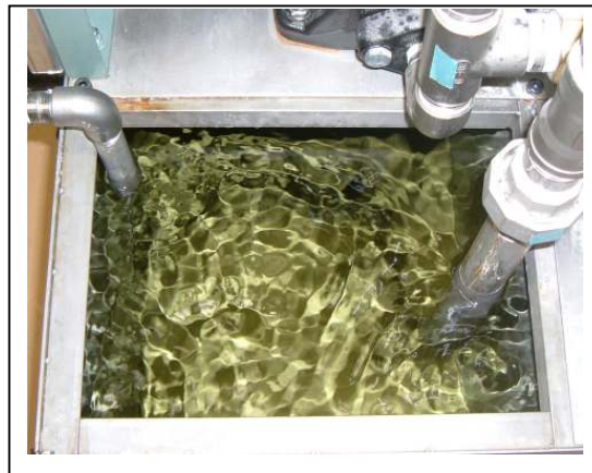
クリーンタンク(三週間後)