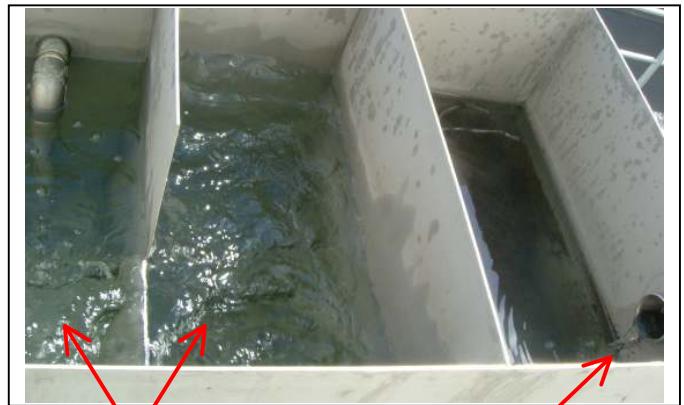
浄化状況(無色透明) (浄化槽内)